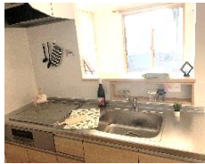
キッチン前のスパス ラック&コンロ前の パネルはマグネット対応