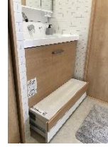
洗面台の下部は 収納兼ステップ