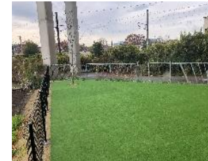
公園代わりに使える自由広場