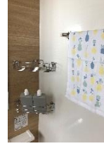
浴室内 収納ラック