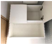
トイレ上部棚 物が隠せる扉付