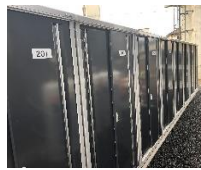
タイヤなど収納できる 外部の専用物置