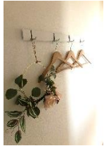
玄関ホール フック