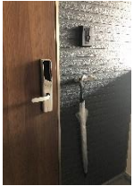
玄関扉横 傘・荷物かけ