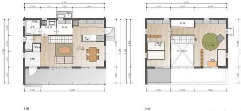
延床面積 91.91㎡ (27.79坪)